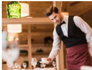
Service- und Dienstleistungsgewerbe