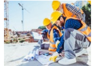
Industrie und Fertigung