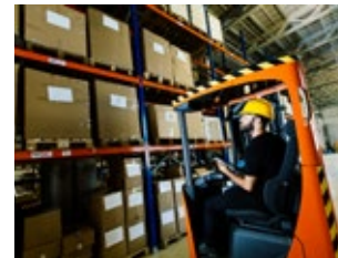
Lager und Logistik