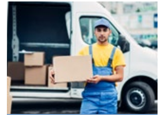
Außendienst und Berufskraftfahrer