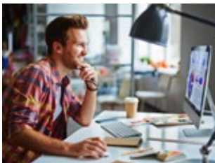
Selbstständige und freie Berufsgruppen