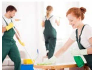
Reinigung und Sicherheit

Die medi-Gesundheitsgruppe GmbH hat sich in 25 Jahren zu einem Kompetenzzentrum für Prävention, ambulante Reha-Maßnahmen, Krankengymnastik und Sporttherapie entwickelt und stellt sich Ihnen als erfahrener Partner für den Bereich der betrieblichen Gesundheitsförderung vor.