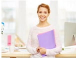
Verwaltungs- und Büroangestellte