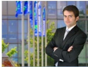
Führungskräfte und leitende Angestellte

Auch beim Thema Bewegung, Ernährung und Entspannung.