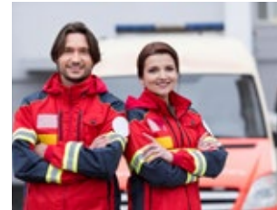
Polizei, Sanitäter und Rettungsdienste